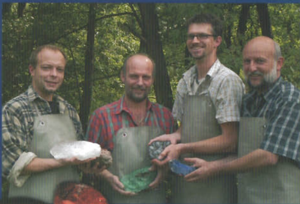
Kellerwaldachat und Jaspis

Fotos: pitzeEckart, Stefan Meroch, Miriam Willnat • Grafik Design: Miriam Willnat